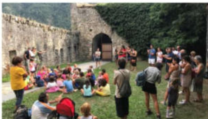
Il Forte di Vinadio

La Fondazione Artea dà il via alla stagione 2019 con visite guidate, itinerari multimediali, laboratori ed eventi Family and Kids Friendly