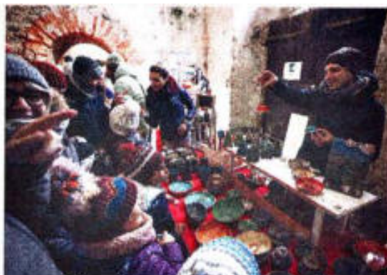
Mercatino natalizio al Forte

Il mercatino sarà aperto sabato dalle 14 alle 19