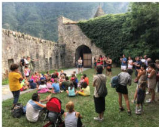
Forte di Vinadio

■ Mercoledì 1° maggio, con un ampio e rinnovato ventaglio di percorsi e attività dedicate alle famiglie con bambini, la Fondazione Artea riapre al pubblico il Forte di Vinadio. Per tutto il mese di maggio si potrà visitare il bene ogni domenica e nei giorni festivi dalle 10 alle 19, mentre a giugno, oltre alla domenica, sarà aperto anche il sabato dalle 14,30 alle 19. Si proseguirà fino a fine ottobre con orari specifici per ciascun periodo. L'offerta per la stagione 2019 comprende il tradizionale itinerario storico con visita guidata, i percorsi multimediali "Montagna in movimento" e "Messaggeri alati" e le postazioni di "Vinadio Virtual Reality" (VVR). Alle visite guidate sono abbinati i nuovi itinerari Family and Kids Friendly, ideati e realizzati con il progetto "Mammamia che Forte!", finanziato dalla Fondazione CRC nell'ambito del bando "Musei da vivere 2018-2019". Diverse sono le opzioni di ingresso: "Montagna in movimento" e "Messaggeri alati" al costo di 7 euro intero e 5 ridotto; visita guidata al Forte a 6 euro intero e 4 ridotto; l'esperienza virtuale "VVR" al prezzo di 3 euro, oppure il cumulativo dell'intera offerta a 10 euro intero e 8 ridotto. Sono previste aperture straordinarie e