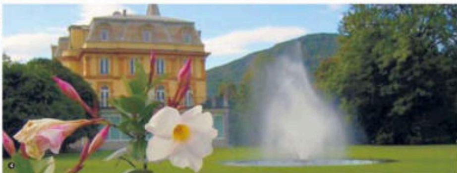
1. La Torre del Conte Ballada di Saint Robert a Castagnole delle Lanze (Ac); 2. Il Castello di Rocca Grimalda (Al); 3. Il Castello dei Principi Acaja a Fossano (Cn); 4. I giardini di Villa Taranto a Pallanza (Vco)

Piccola guida pratica alle dimore storiche che resteranno aperte il giorno di Ferragosto e lungo tutto il weekend. Un ventaglio variegato di proposte tra visite guidate, mostre e attività organizzate.