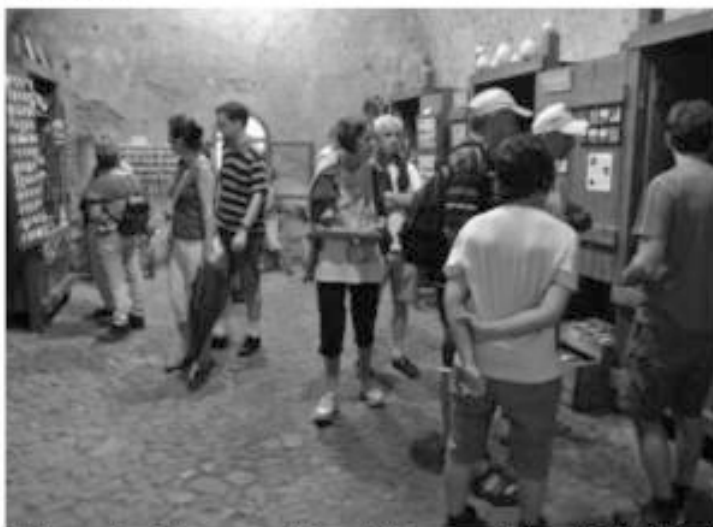
Un'immagine della scorsa edizione del Temporary Shop al Forte di Vinadio

L'iniziativa, nata nel 2013, è fortemente correlata ai contenuti di "Montagna in movimento", percorso multimediale allestito all'interno del Forte, che dedica una delle sue sezioni proprio alle nuove prospettive di vita in montagna. La provincia di Cuneo presenta infatti una forte personalità storica: i numerosi ricordi del passato che custodisce devono essere salvaguardati in quanto parte essenziale dell'identità di questi luoghi. Ne sono un esempio i numerosi mestieri artigiani che un tempo si praticavano, soprattutto nelle vallate alpine, e che sono andati via via scomparendo. Ma sono molti i giovani che negli ultimi anni hanno intrapreso un percorso per ricostruire una parte della storia delle loro famiglie, cominciando proprio da quei mestieri che svolgevano i loro avi. Riscoprono così un'abilità manuale che fa parte del loro DNA e la fanno rivi-